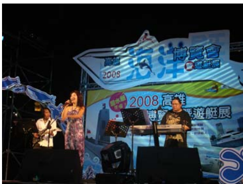
雅仕爵士樂團現場演出