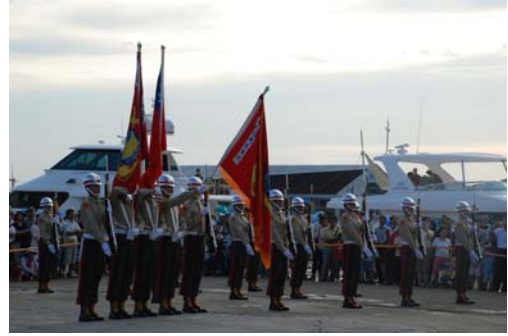
海軍樂儀隊精采表演