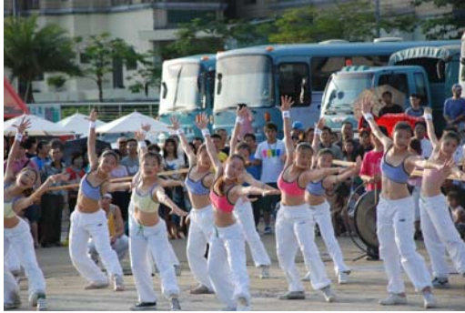
開幕典禮-中華藝校表演