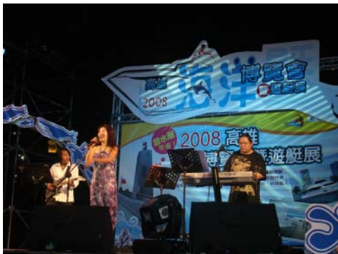
雅仕爵士樂團現場演出